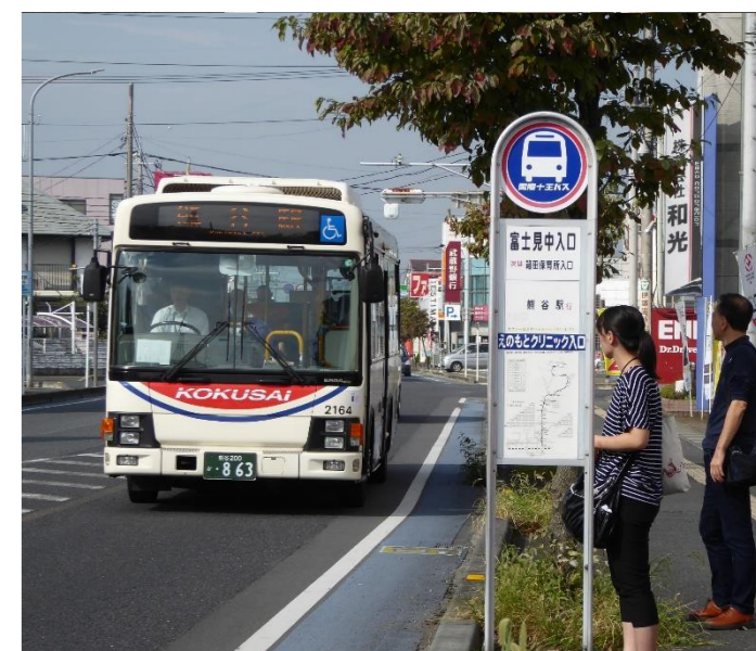
さいたま博通りの各バス停では多くの利用客がいました。