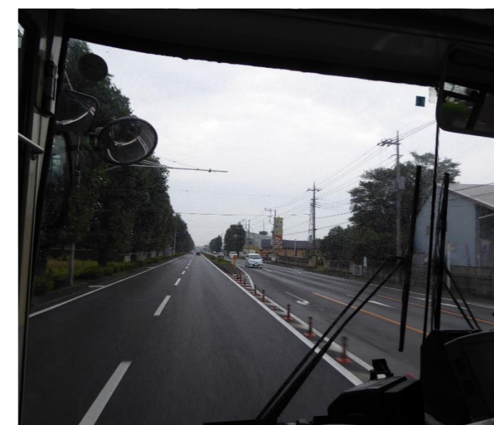
葛和田への回送中の一コマ。運転手さんしか知らない一面。