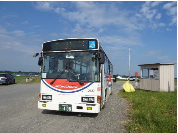
昼下がりの葛和田バス停