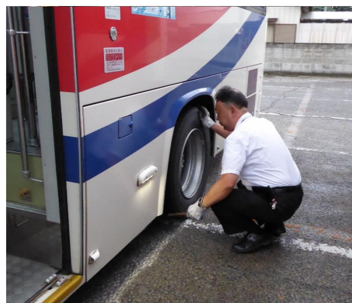
タイヤに異常はないか特別なハンマーで点検します。