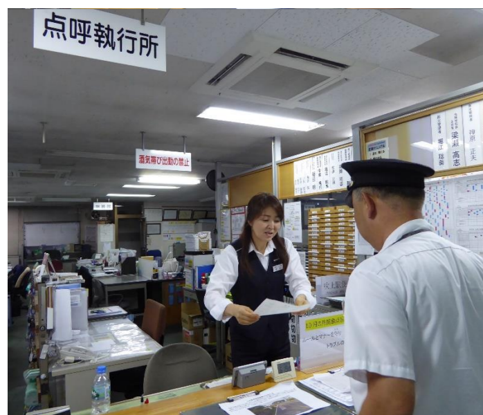
運行管理者と1日の乗務の点呼を行います。

※：運転手さんの持つ行路表には専用の番号が割振られていて、それによって運転をしています。