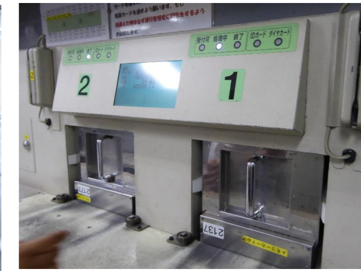
運賃清算の機械。この日の収入は6万円ほどでした。