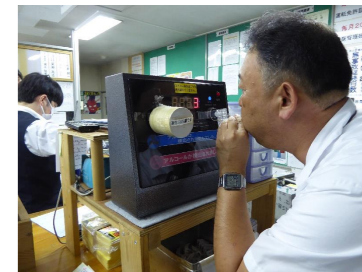
営業所へ帰って来て初めにアルコールチェック。厳しい…