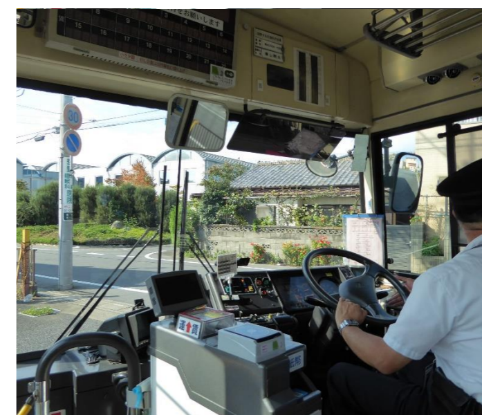
運転中は常に安全運行に努めて運転していました！