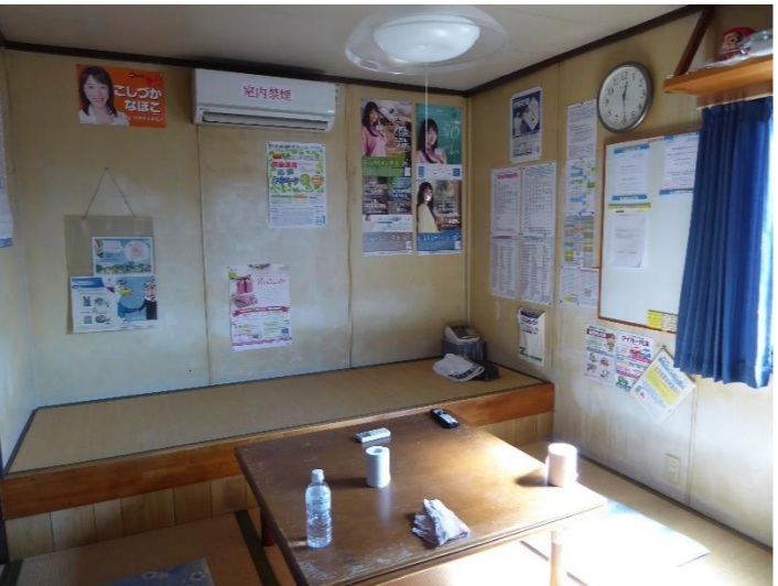
箱田車庫の様子。詰所には仮眠室もあります。