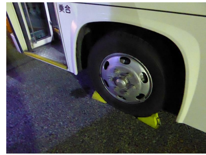
車止めを入れバスを降ります。