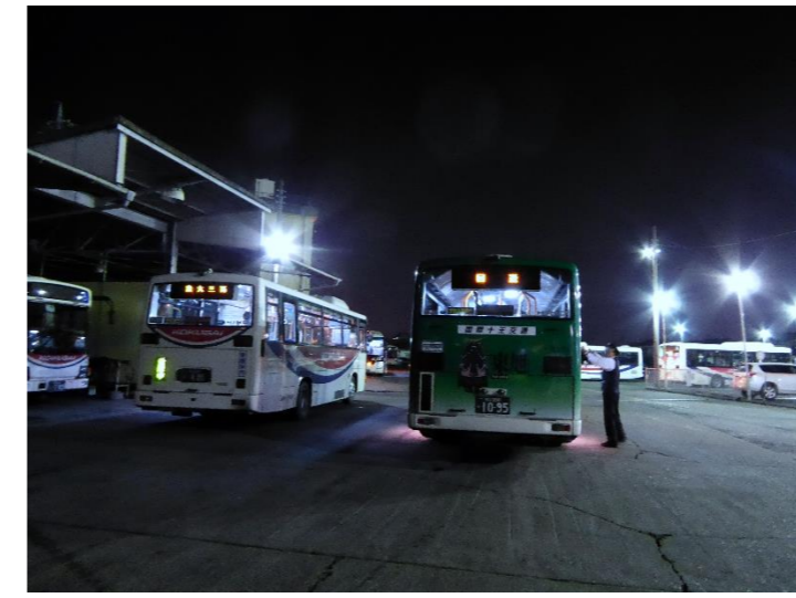
営業所へ戻り、給油・清掃を行います。