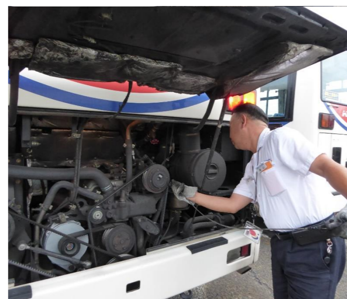
エンジンルームもきちんとチェックします！